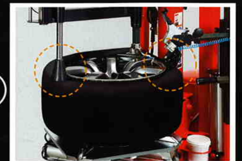
5 上ビードのはめ込み

下ビードを持ち上げます。扁平タイヤの場合はレバーを使わずにそのままローラーだけで下ビードを外します。