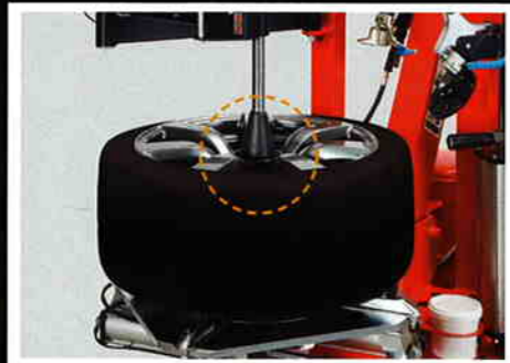
1 ホイールのチャッキング

ホイールセンターにセンターコーンをセットしてホールドプレスで押し込めることにより、ホイールのチャッキングを容易にします。