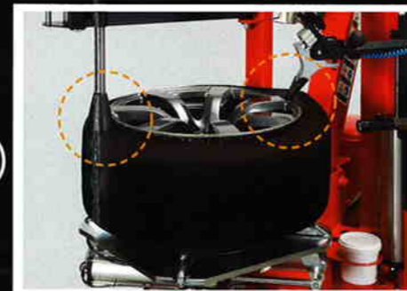
3 上ビードの引き上げ

MDツールをセットしタイヤとリムの間へ差し込みます。回転させながら差し込むことでスムーズに挿入できます。