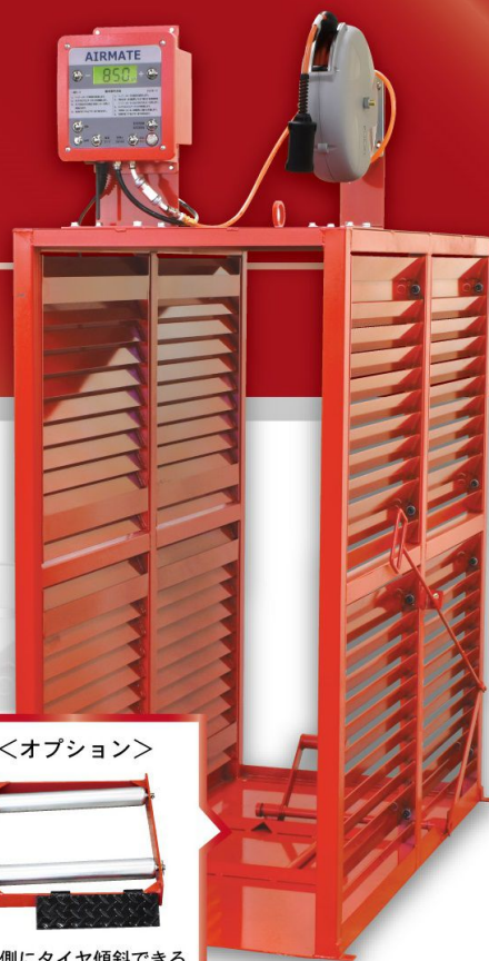
■TD-TB1・i + TM-500 + エアーリール