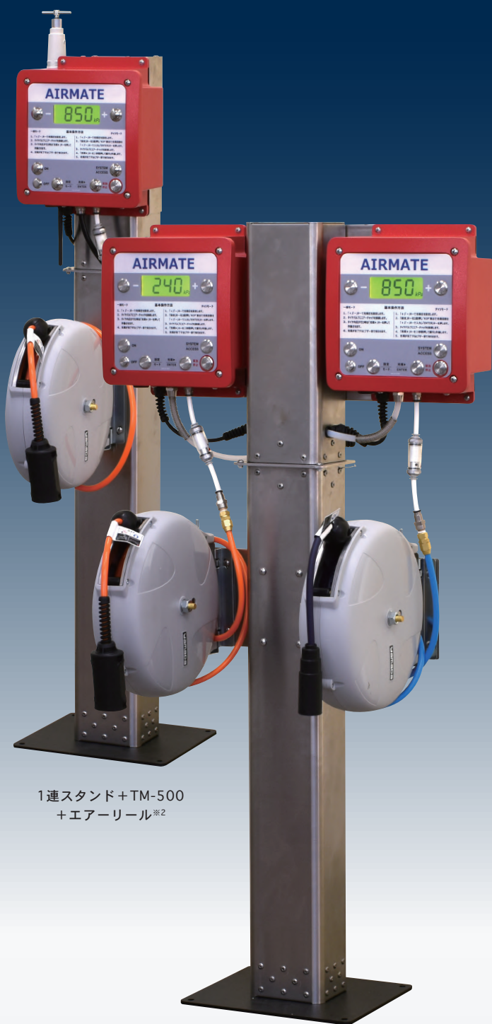
1連スタンド+TM-500 +エアーリール ※2