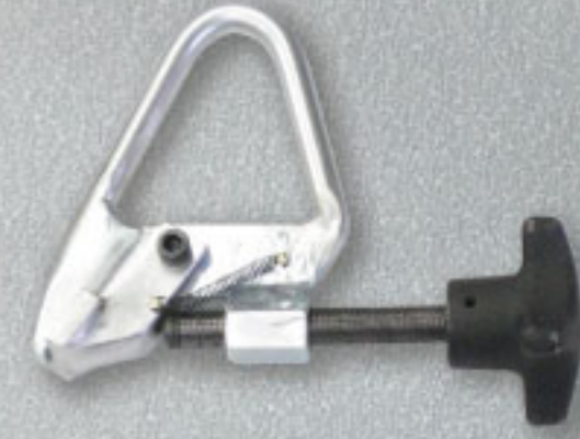
◆マウントクランプ