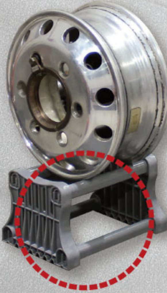
チャックスタンド

LTホイールなど小径リムのチャッキング着/脱工程時に手でチャック爪まで持ち上げたり、手でチャック爪から床に降ろすことなく安全に作業できます。